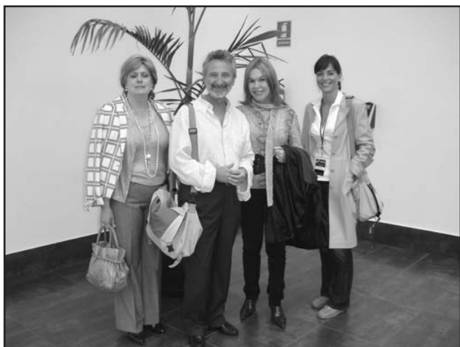
Patólogos da Universidade de Granada com a Presidente da SBC